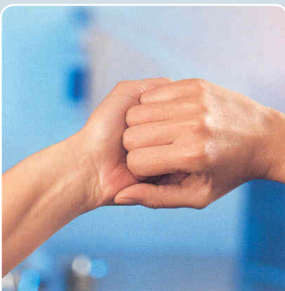
4 Geballte Faust in der Handfläche