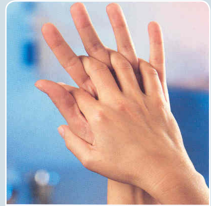
3 Zwischenräume der Finger