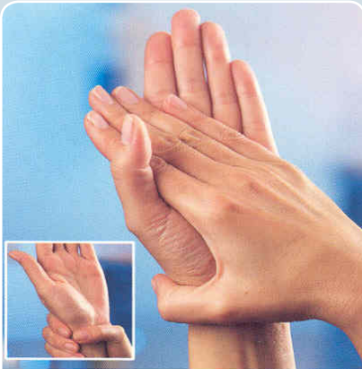
1 Handfläche auf Handfläche

1 - 2 Hübe Desinfektionsmittel auf die Hand und vollständig verreiben: