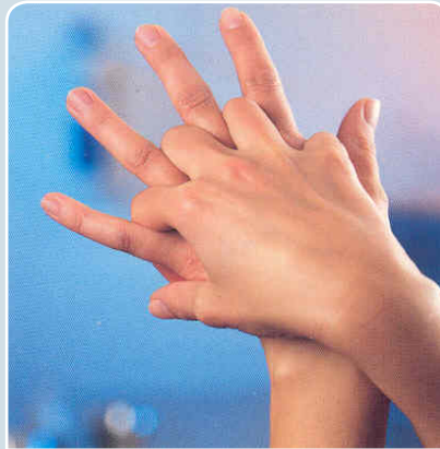
2 Handfläche über Handrücken